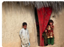
Nos lieux de vie