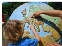
Les enjeux de notre société