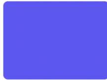
Ajouter votre thème